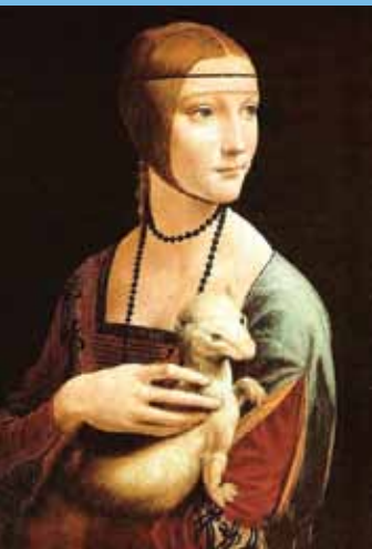
'Damen med hermelen' af Leonardo da Vinci

Sidste tirsdag i måneden, kl. 10.30-12. Start 27/09/11. Slut: 29/05/12