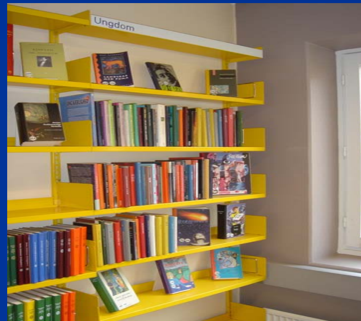
● Blågården 2005