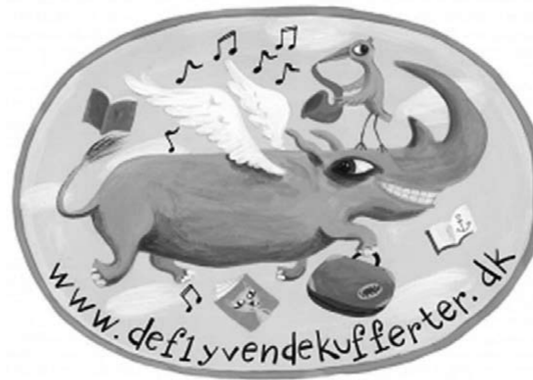
Illustration: Cato Thau Jensen

I lyset af den aktuelle debat om biblioteker og bøger, så er dette citat interessant. Bibliotekerne kan altså godt låne bøger ud, som ellers ikke bliver valgt sådan helt ”frivilligt”. Hvis vi formidler på den måde, at vi siger ”se denne bog – den skulle du ta’ at læse!”, så bliver det rent faktisk modtaget positivt! Når vi kender vores lånere og